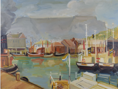
Tableau - "Le port"