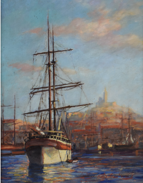
Tableau - "Marseille"