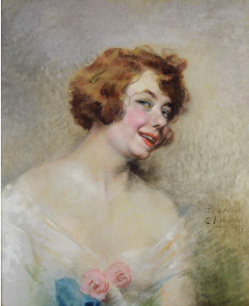
Tableau - "La dÃ©licieuse PrimevÃ©re"