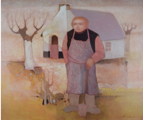
Tableau - "Le fermier"