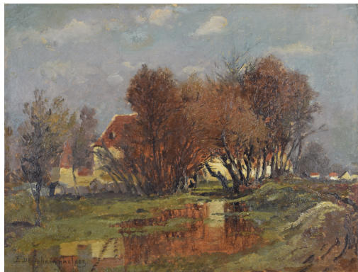
Tableau - "Le village derriÃre les arbres "