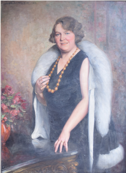
Tableau - "La femme au collier"