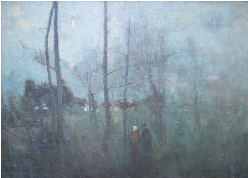
Tableau - "Promenade au claire de lune"