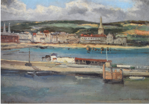
Tableau - "Vue de Weymouth (Dorsetshire)"