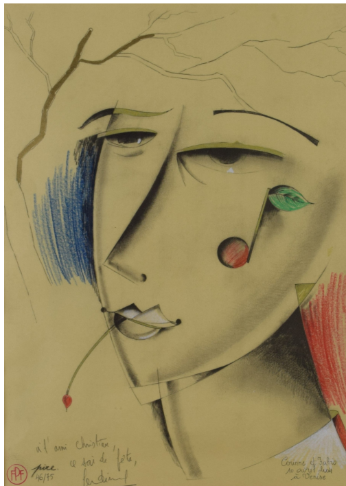
Tableau - "Le visage"