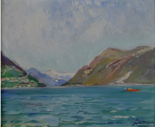
Tableau - "Promenade sur le lac"