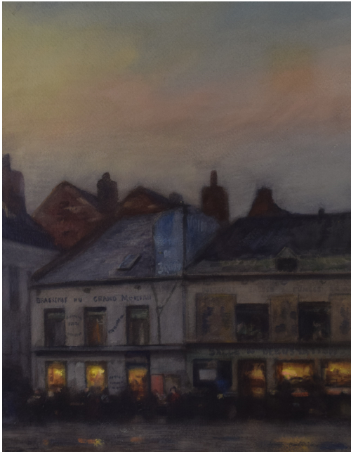
Tableau - "Brasserie du grand morvan"