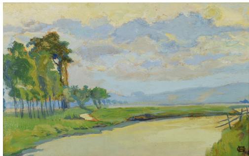
Tableau - "Coxyde"