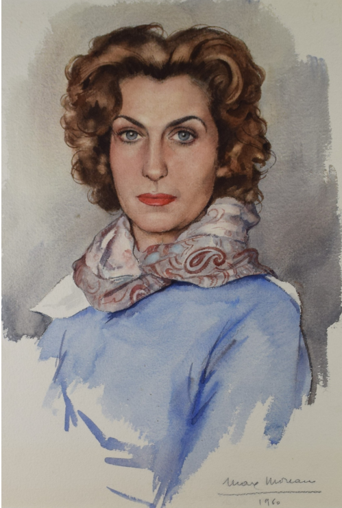
Tableau - "Simonet L New-York "