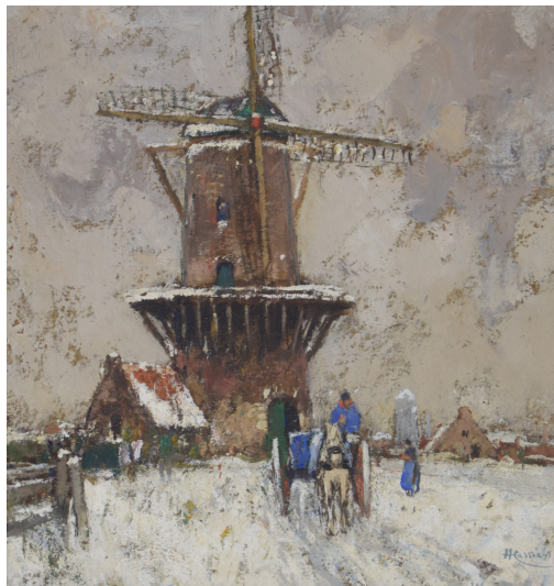
Tableau - "Neige en flandre"