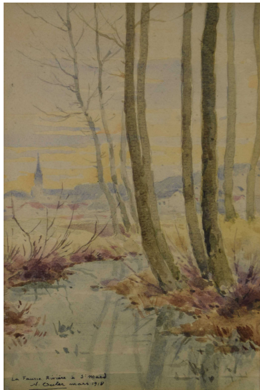
Tableau - "La fausse rivière à saint Mard"