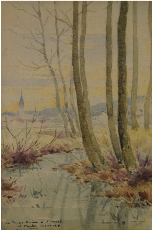
Tableau - "La fausse rivière à saint Mard"