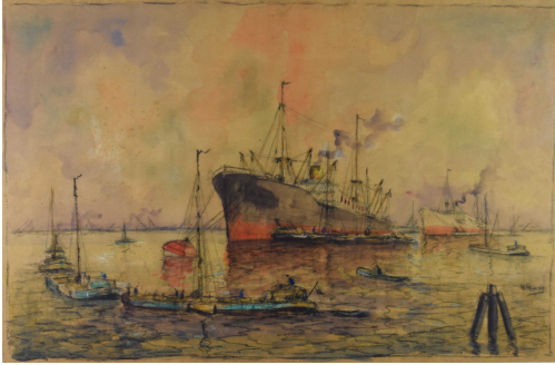
Tableau - "Le port animé" © "