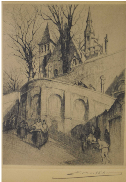
Tableau - "Eglise Saint-Donat d'Arlon"