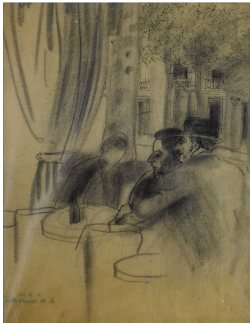
Tableau - "L'apÃ©ro"