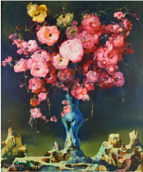
Tableau - "Le bouquet"