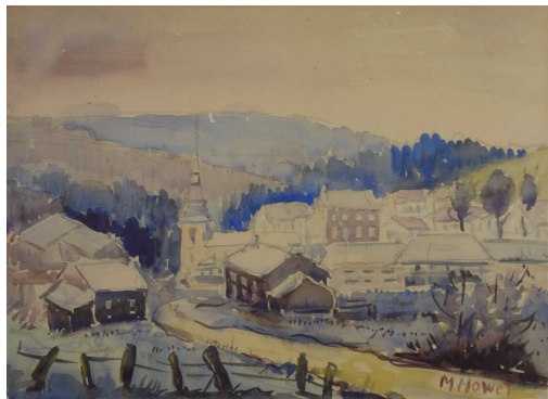
Tableau - "Le village ardennais "