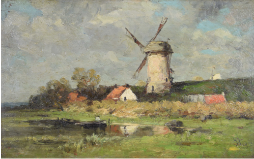
Tableau - "Devant le chenal"