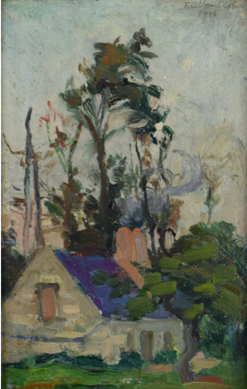
Tableau - "La fermette"