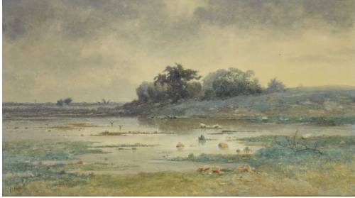
Tableau - "Les oiseaux de la cÅ´te"