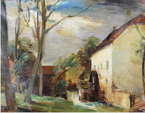
Tableau - "Le moulin"