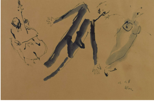
Tableau - "Le bassiste et collègues "