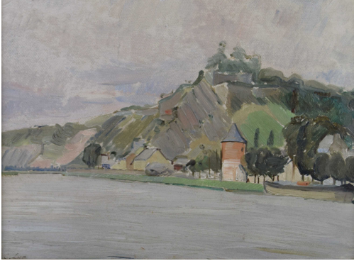
Tableau - "La meuse"