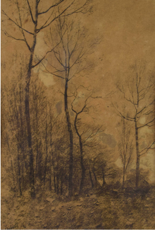
Tableau - "Les fermettes aux environs de Tervuren"