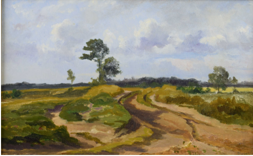
Tableau - "Le chemin sablonneux "