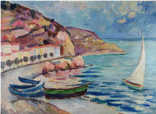
Tableau - "La c te d'azur "