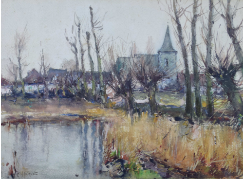
Tableau - "L'Église du village"