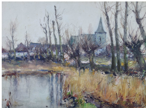
Tableau - "L'Ã©glise du village"