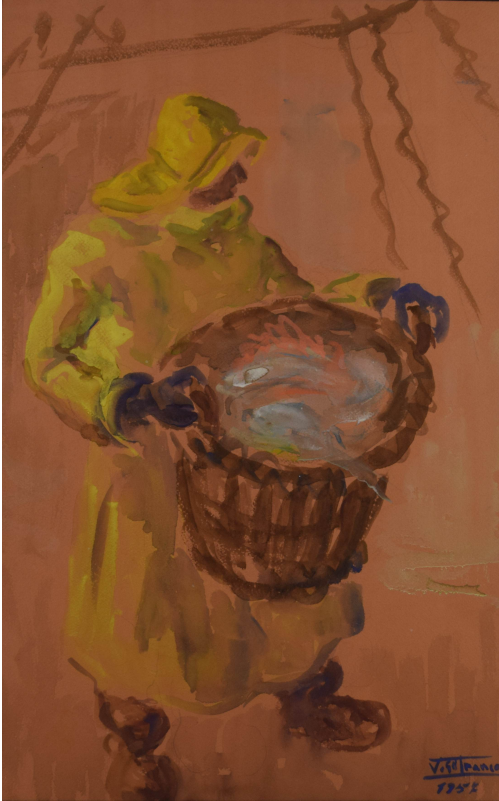
Tableau - "Le produit de la pêche"