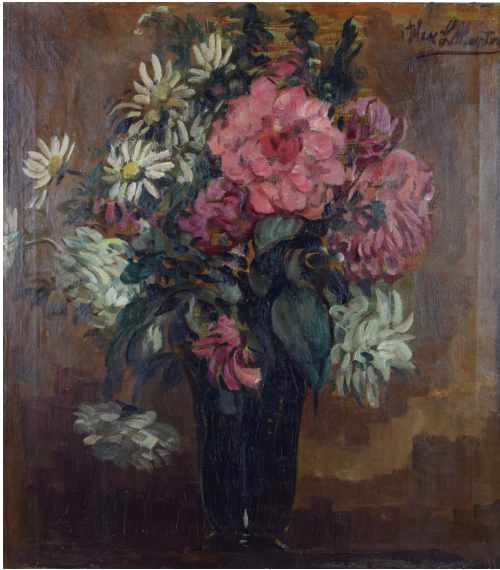
Tableau - "Le bouquet aux marguerites "