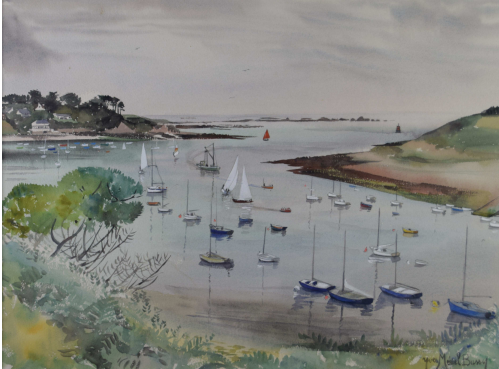
Tableau - "Saint-Pabu (Finistère)"