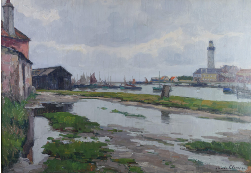
Tableau - "Grand Fort Philippe (France) "