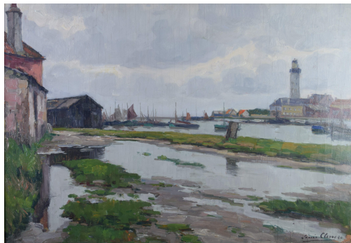
Tableau - "Grand Fort Philippe (France) "