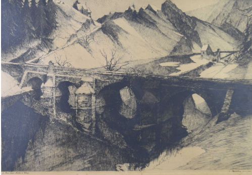
Tableau - "Le pont saint Nicolas à Chiny"