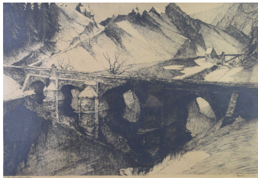
Tableau - "Le pont saint Nicolas Ã Chiny"