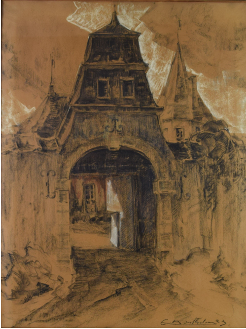
Tableau - "L'entr e du ch teau ferme"