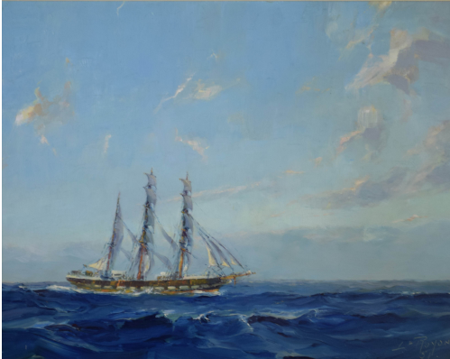
Tableau - "le 3 mats "