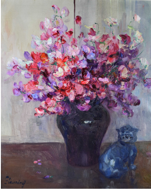
Tableau - "Fleurs au dragon chinois "