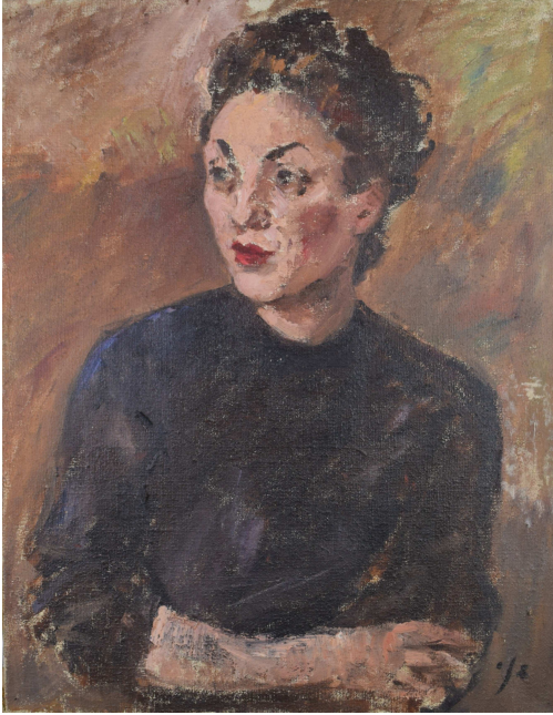
Tableau - "Portrait de femme"