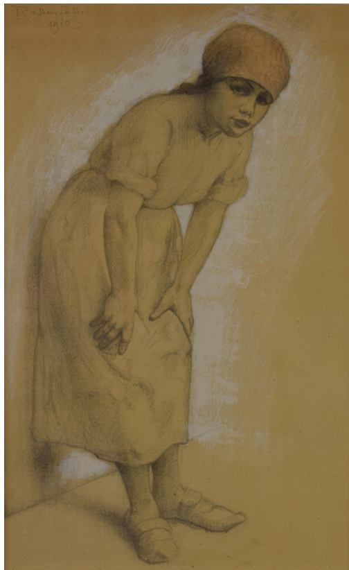
Tableau - "La hercheuse "