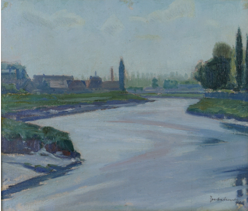
Tableau - "Au loin le village"