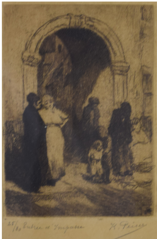
Tableau - "Entrée d'impasse"