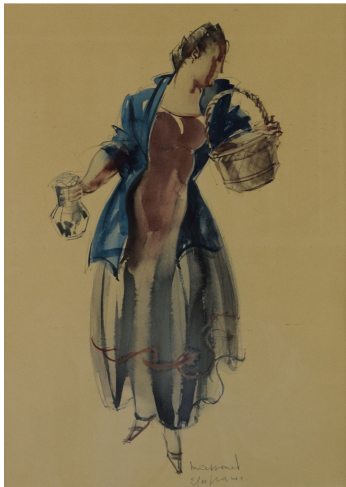
Tableau - "La cantinière "