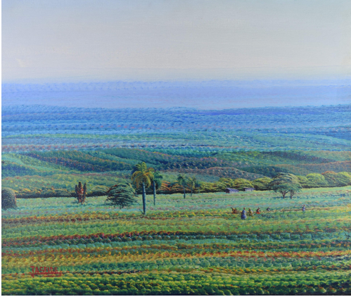
Tableau - "Paysage animé de Haïti "