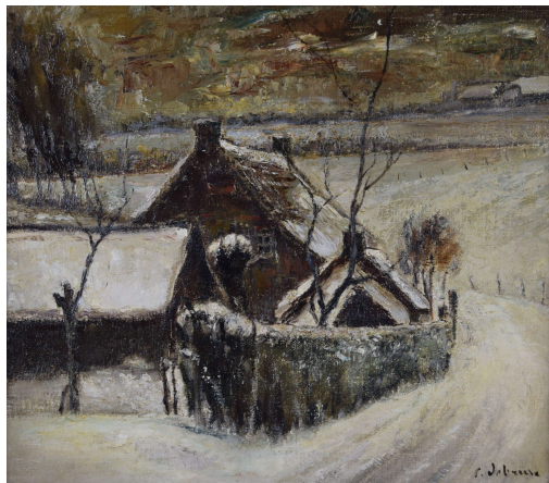
Tableau - "La maison de campagne"