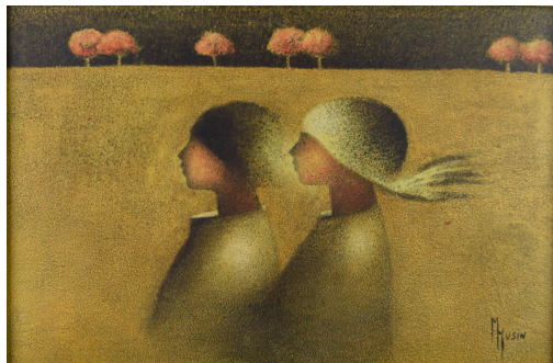
Tableau - "Couple nocturne "