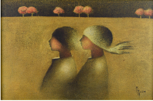
Tableau - "Couple nocturne "