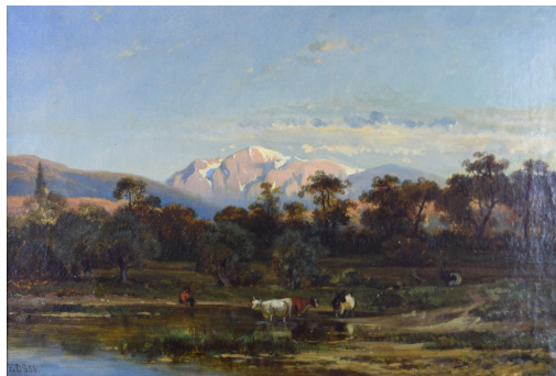
Tableau - "Journé pastorale "