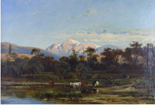
Tableau - "Journé pastorale "