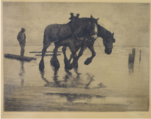
Tableau - "Chevaux sur la grève"