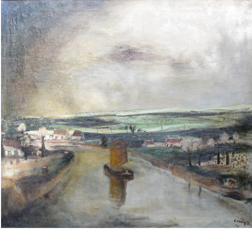
Tableau - "L'Escaut "