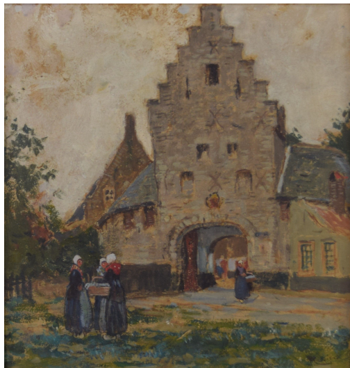
Tableau - "La porte de la ville"